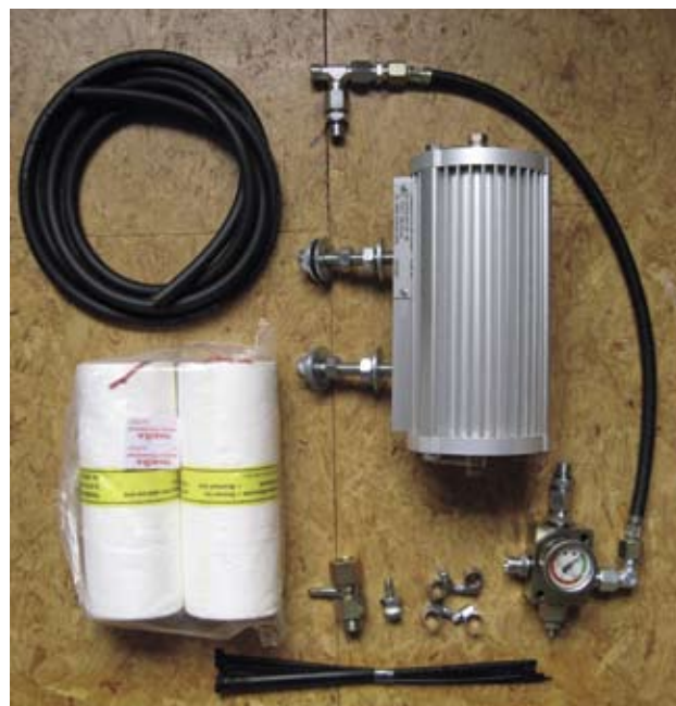
Einbausatz eines Nebenstromfilters – hier: Marke Trabold

Der Trabold-Filter behauptet sich seit ca. 20 Jahren am Markt. Damit ist er keine "Innovation" im Wortsinne, aber sicher ein Produkt, das für den Einen oder Anderen eine "Neuheit" darstellt und dessen Einsatz sicherlich eine Überlegung wert sein kann.